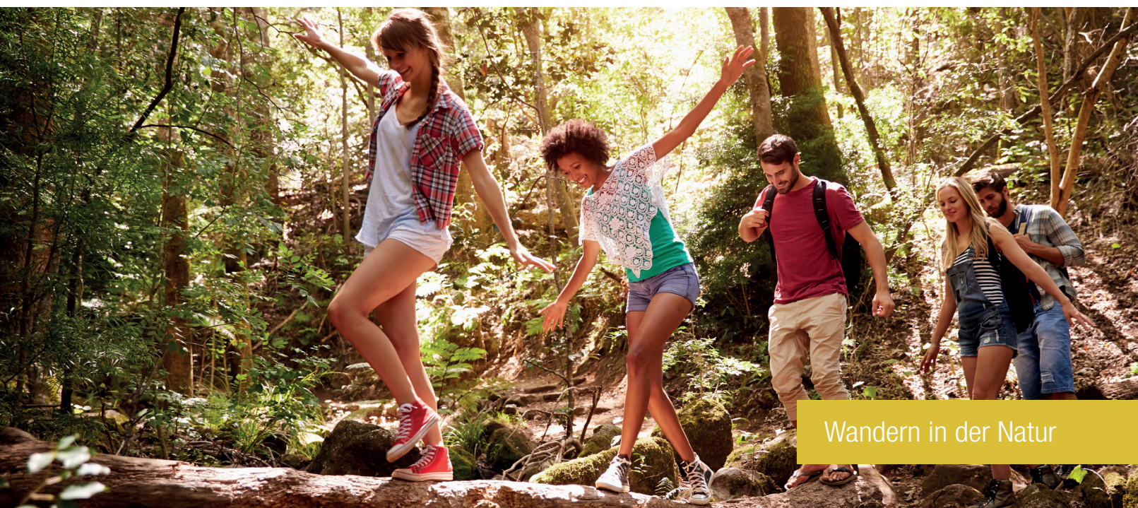
Wandern in der Natur